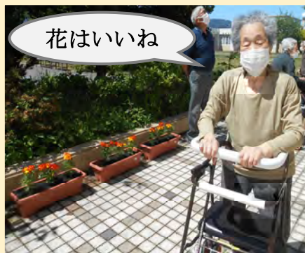
6月はデイサービスの中庭で鉢植えの中にマリゴールドを植えました。天気も良く久しぶりの日向ぼっこでした。