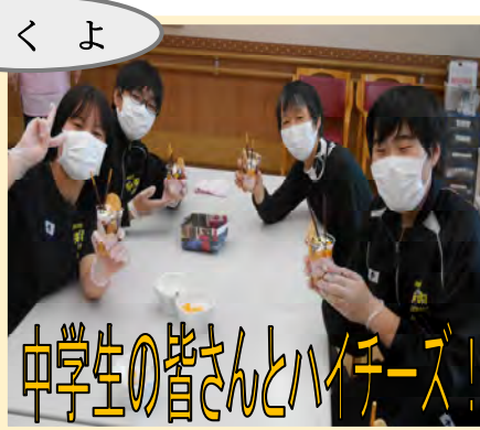
中学生の皆さんとハイチーズ！ 6月に中学生の職場体験がありました。この日はクッキングの日でした。一緒に作りました。