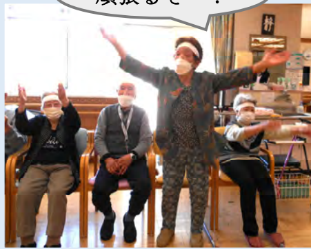
6月はミニ運動会を行いました。今年は広いホールで行うことが出来て、利用者様ものびのびした様子で参加されていました。