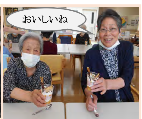
6月と7月はクッキングを行いました。フルーチェパフェを作りました。出来上がり〜♪