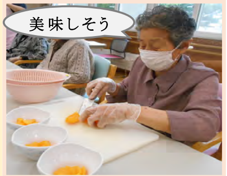
桃とみかんの缶詰を切っている様子です。カップにフルーツやおやつを入れて作りました。