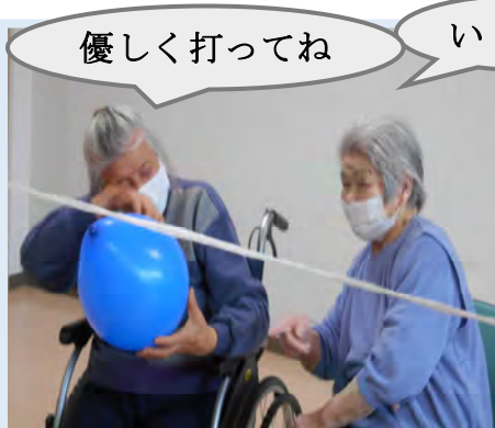
5月のレク、ミニバレーの様子です。皆さん真剣に取り組んでいます。 頑張るぞー！