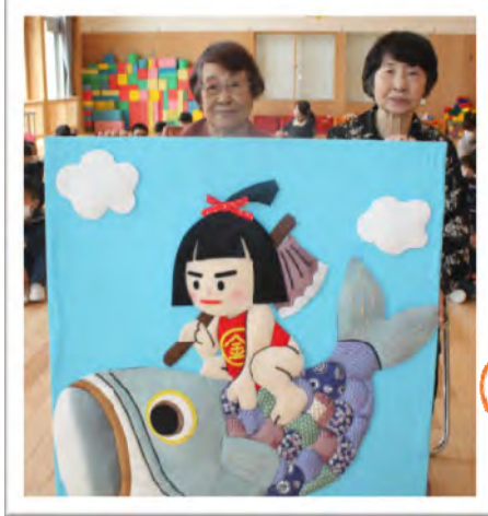
知内認定こども園にこいのぼりと 金太郎押絵を寄贈