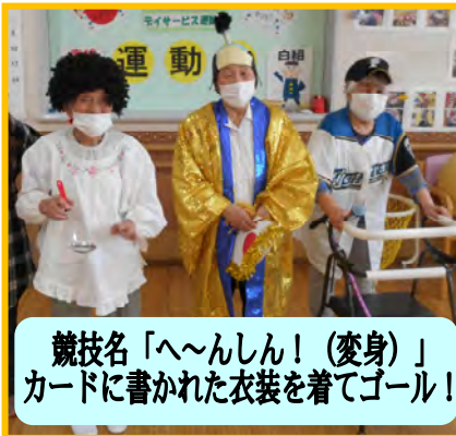
競技名「へ〜んしん!(変身)」 カードに書かれた衣装を着てゴール!